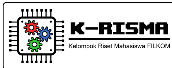
Gambar 2. Lambang untuk Selain Surat